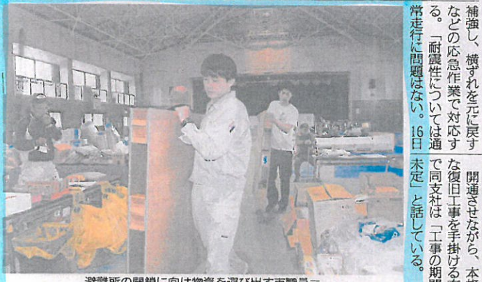
避難所の閉鎖に向け物資を運び出す市職員＝28日、由布市湯布院町の由布院小学校体育館

石井氏「大分道が回復する」とは、「九述べた。西日本高速道路九州支社によると、16日から通行止めが続く大分自動車道の湯布院IC―日出JCTの間は28日までに仮復旧に向けた工法のめどがつき、連休明けの開通を目指して作業を進めている。土砂崩れや橋の損傷など被害の大きかった現場もあるため、一部区間で上下4車線を2車線にして対面通行にする。復旧が最も難航している並柳橋(長さ422.4m、高さ最大48m)は、橋桁を